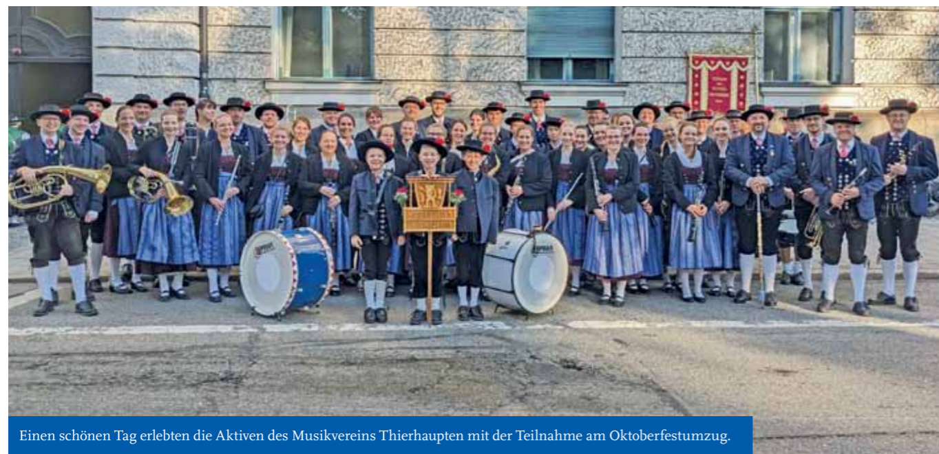
Einen schönen Tag erlebten die Aktiven des Musikvereins Thierhaupten mit der Teilnahme am Oktoberfestumzug.

Wir möchten diesen Advent wieder einen „Begehbaren Adventskalender“ in Neukirchen und Hölzlarn organisieren. Jeden Abend um 18.00 Uhr öffnet sich ein bunt gestaltetes Adventsfenster. Wir laden Euch ein, den Advent bewusst zu erleben mit einem kleinen Abendspaziergang und schönen Begegnungen in der Dorfgemeinschaft.