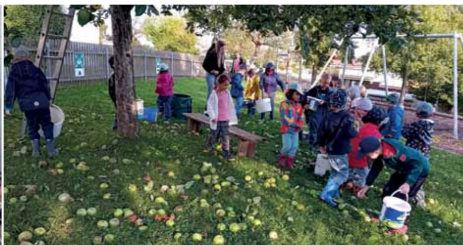
Apfelsaftaktion der Kindertagesstätte St. Peter und Paul Thierhaupten mit den Vorschulkinder: Ein besonderes Erlebnis für alle!