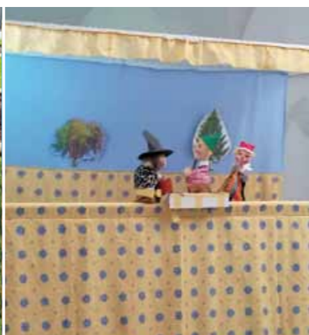
Pfarrfest der Pfarrei St. Peter und Paul: Der Bastelstand der Kindertagesstätte und das Kasperltheater erfreuten sich sehr großer Beliebtheit!