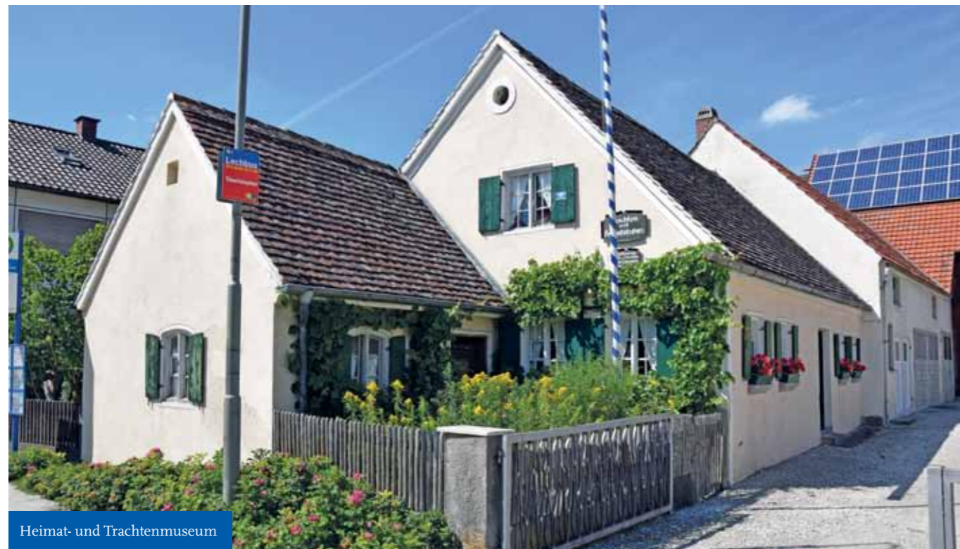
Heimat- und Trachtenmuseum

Alles weitere hier, im Newsletter christoph.gleich@gmx.de oder bei Facebook